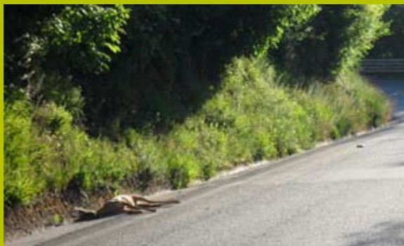
Provincia di Siena: foto Gianpiero Pinassi