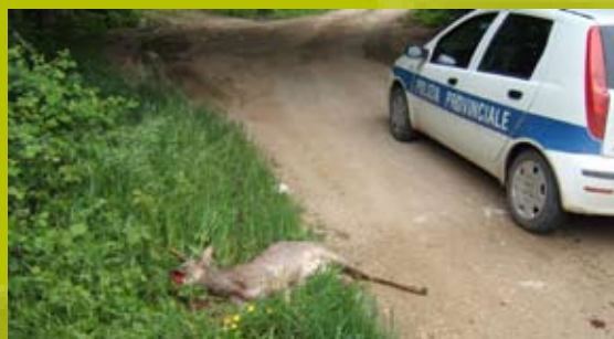
Provincia di Perugia: foto NOMEXXXX