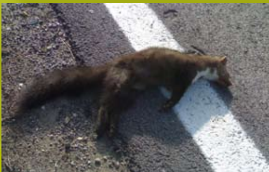
Provincia di Terni